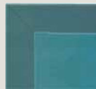
Proget kasa kanat köşe detayı