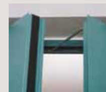
Kanat düzenleyici sistem