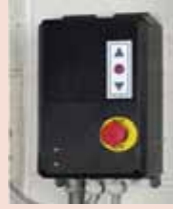
Hız kontrollü panel