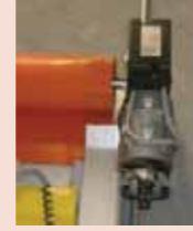
380 V endüstriyel tip motor