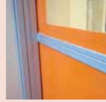
Rüzgâr güçlendirme profili