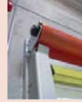
Kendinden destekli yapı