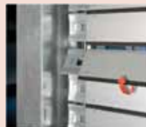
Yenilikçi panel tasarımı